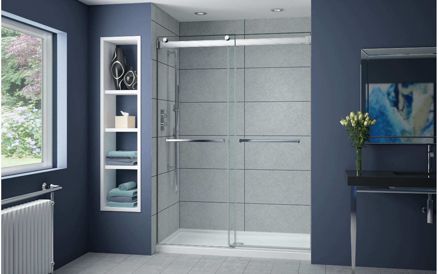
Model shown / Modèle présenté : Gemini In-Line Bypass plus / Gemini en alcôve bidirectionnel plus (NPS160-11-40)